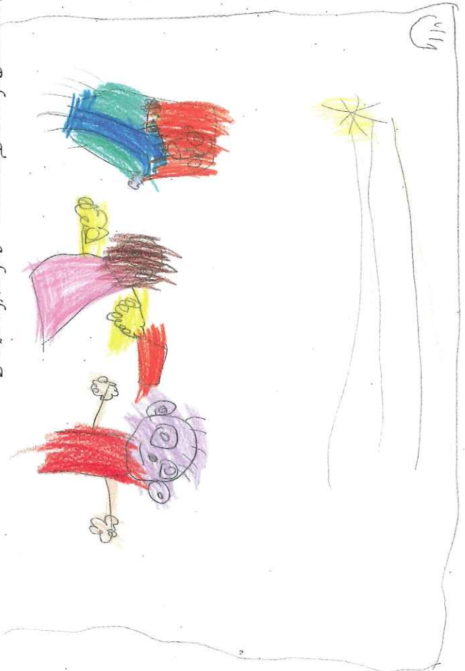
Cayetano Balaguer Torregrosa · Infantil 3 años 2A